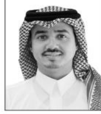
أ. معاذ بن جبر بن عطيه البجالي